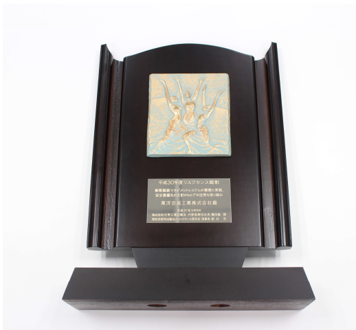
平成30年度リスクセンス顕彰楯

今後も継続的に、従業員への安全意識の向上に取り組み、「安全最優先」の企業文化を醸成してまいります。